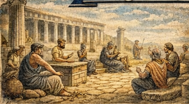
► İyon Düzeni