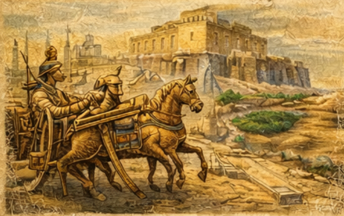
► At ve Savaş Arābasi