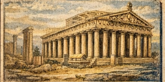
► Artemis Tapınağı (Efes)