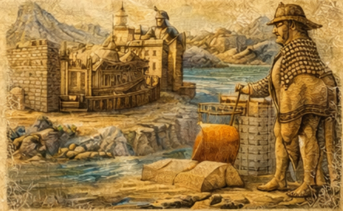
► İrmäktä Üsler