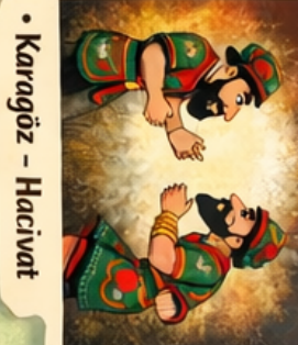
• Karagöz - Hacivat