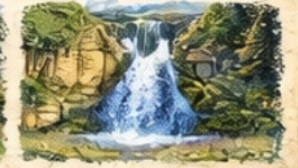
Soğuksu Milli Parkı