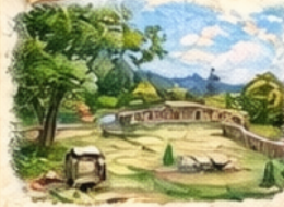
Atatürk Orman Çiftliği