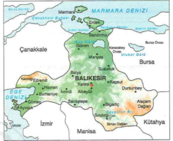
Balıkesir Fiziki Haritası

Bu haritadan Balıkesir'in göreceli konum özelliklerinden hangisine ulaşamaz?